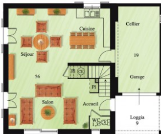
MC 88 - 143 Surface habitable : 115 m 2 Annexes : 19 m 2 Loggia : 9 m 2