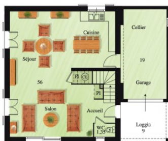
MC 88 - 143 Surface habitable : 115 m 2 Annexes : 19 m 2 Loggia : 9 m 2